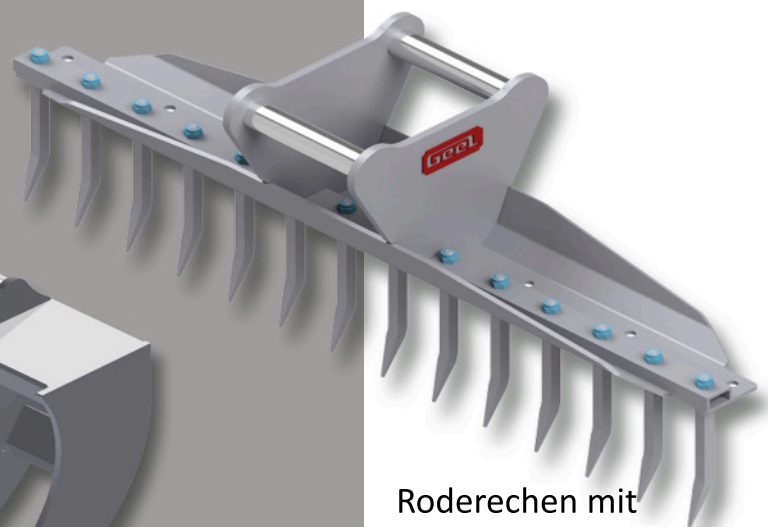
Roderechen mit schraubbaren Zinken