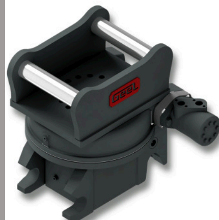
Schnellwechsler mechanisch mit Drehkranz